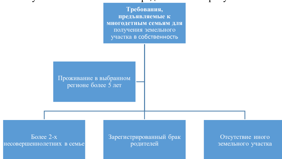
Рисунок 1 - Требования, предъявляемые многодетным семьям для получения земельного участка

Органы исполнительной власти в разных регионах проводят инвентаризацию земельных участков, осуществляют кадастровые работы, устанавливают размер земельного надела, формируют очередь и передают гражданам в собственность оформленные земельные участки с инфраструктурой. Усредненным размером таких участков по всей стране является показатель в 8 соток. Максимальный размер достигает 15 соток. Не во всех регионах предлагается возможность получить участок непосредственно в городе, поскольку в большинстве субъектов выделяется земля, находящаяся вне черты города. Требования, предъявляемые многодетным семьям для получения земельного участка в собственность представлены на рисунке 1: