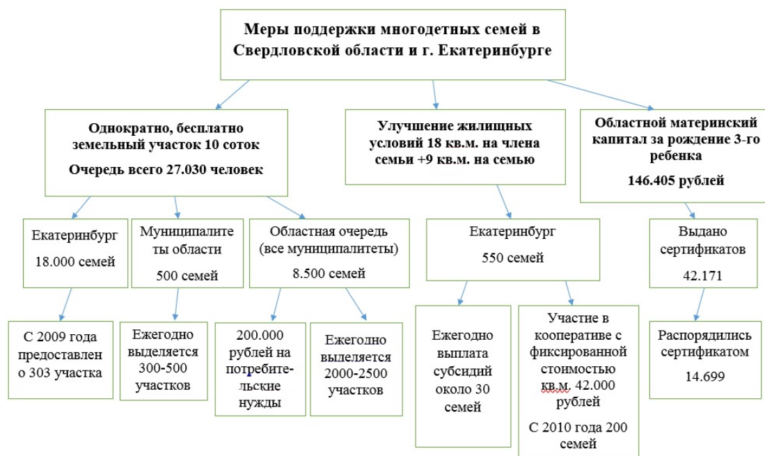
Рисунок 3 – Меры поддержки многодетных семей в Свердловской области и Екатеринбурге

земельного участка подали 27 030 семей. При этом есть очередь «областная», в МУГИСО, и очереди муниципальные. 8,5 тысячи семей подали заявления в областную, остальные 18,5 — в муниципальные очереди: в Екатеринбург, в Салду, в Ирбит и так далее. Превалирующая часть из этих 18 тысяч приходится на Екатеринбург. В городах области больше свободной земли и ожидание в очереди небольшое. В Екатеринбурге свободной земли немного, чаще участки предоставляются на окраинах или в городах спутниках за счёт неразграниченных земель, перечень которых ежегодно формирует МУГИСО. Меры поддержки многодетных семей Свердловской области представлены на рисунке 3.