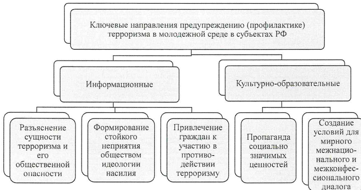
Рисунок 1. Ключевые направления предупреждению (профилактике) терроризма

Перечисленные выше направления реализации Комплексного плана предполагают следующие форматы проведения мероприятий: